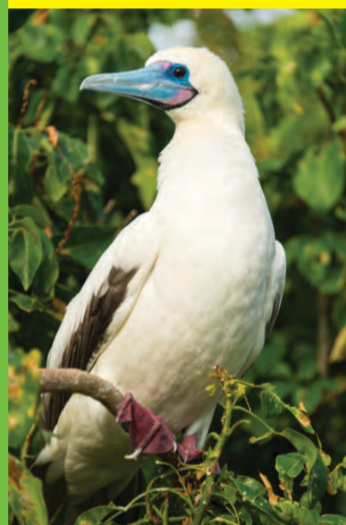
Bobo patas rojas