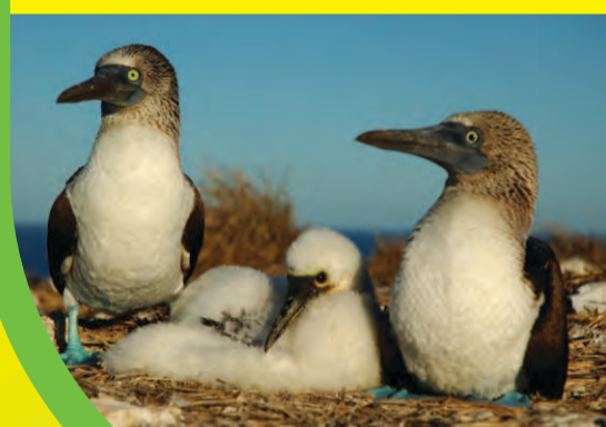
Bobo pata azul